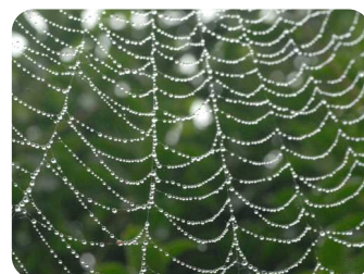
朝露が光るクモの巣