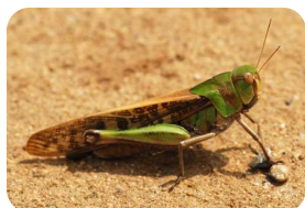
バッタの王様：トノサマバッタ

少し涼しくなってきたら、公園の原っぱへ行ってみましょう。淡い黄色の翅を広げ、勢いよく飛び立つトノサマバッタ。狭山公園の「バッタランド」にはたくさんいます。里山民家の裏の原っぱも、バッタ観察のポイントです。ショウリョウバッタや