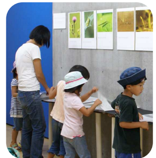
公園で見られる生きものは? 展示をチェック

皆さんから大好評なのが生体展示で、狭山公園では宅部池や北川に昔からすむモツゴなどの魚を、野山北・六道山公園ではトウキョウサンショウウオを見ることができます。どちらも、その愛らしい動きに見入る方が絶えません。