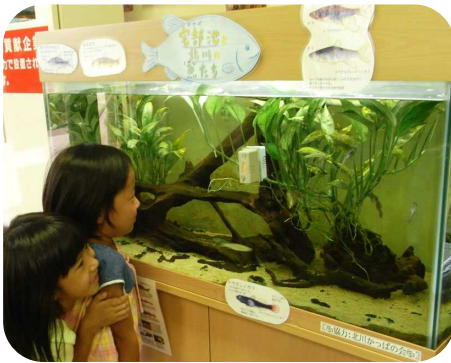
生体展示はみんなに人気!

その他、花や虫などの図鑑、狭山丘陵に関連した本や市民団体のニュースレターなどもあり、ひと休みしながら、様々な情報に触れることができます。