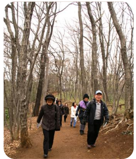
ウォーキングイベント

そこで、3月25日に狭山丘陵の都立公園などを巡る、「きてみて里山! 春のうららかウォーキング」を開催します!当日は、狭山丘陵で保全活動を行う団体