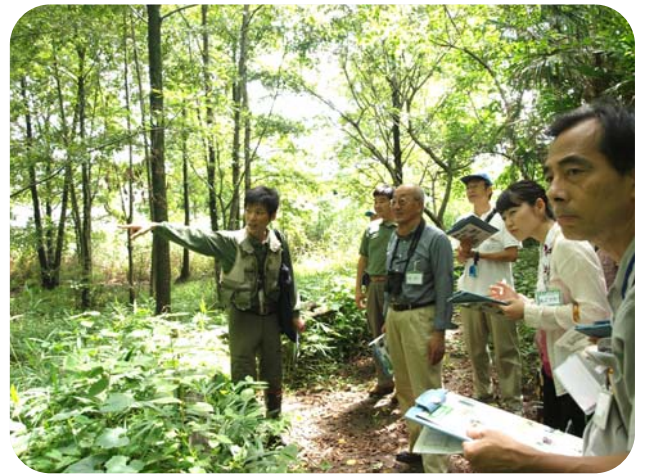
パークレンジャーによる公園案内