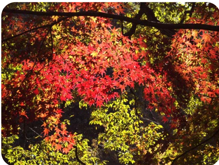
イロハモミジの紅葉

寒さが深まるにつれて、里山は暖かな色に包まれます。最初の変化は黄色から。アオハダやウワミズザクラの葉が雑木林の中で輝きはじめます。次第にコナラやクヌギも染まりだし、雑木林は燃えるようなオレンジに。ところどころに混ざる赤はイロハモミジやヤマウルシ。同じ木の葉っぱでも1枚ごとに染まり方が違い、1枚の葉っぱでも微妙な濃淡があります。いろんな木があって、たくさんの色がある、この多様さが里山の美しさの理由なのだと感じます。秋の色に包まれながら、雑木林を歩いてみてはいかがでしょうか。