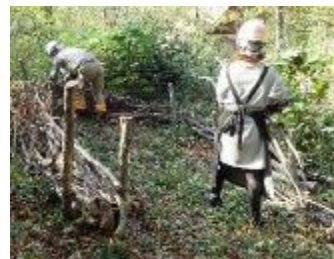
落ち葉をためる よだ 粗朶柵