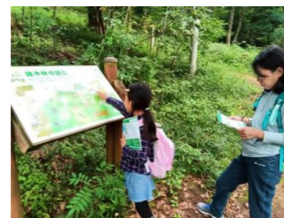
雑木林クイズラリーの様子