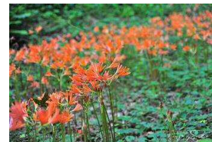
キツネノカミソリ