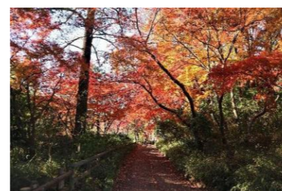
宅部池のイロハモミジ