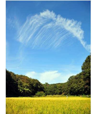
稲が実った岸田んぼ