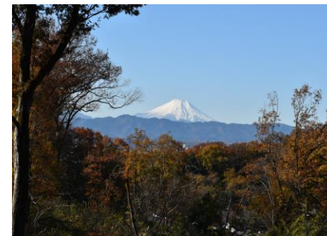
もみじ広場から眺める富士